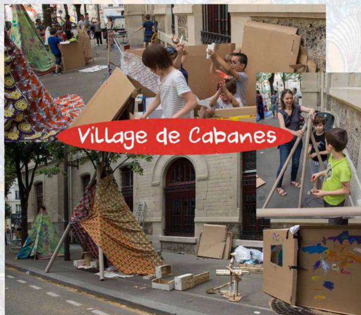
Village de Cabanes