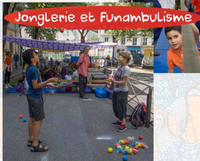
Jonglerie et Funambulisme