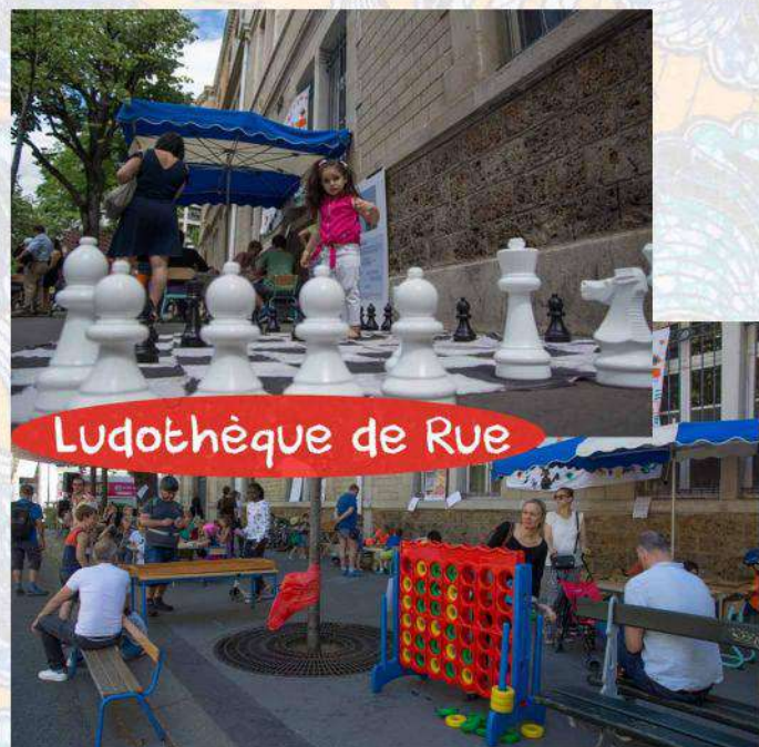
Ludothèque de Rue