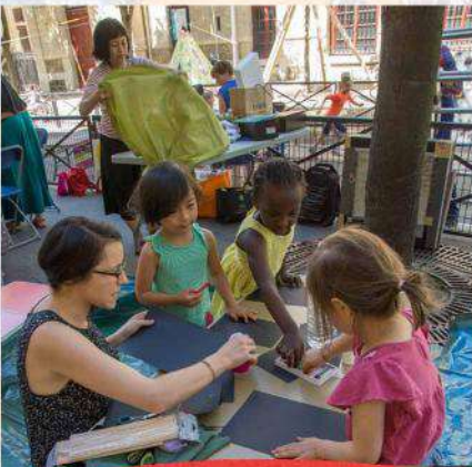
Bidouille et Patouille