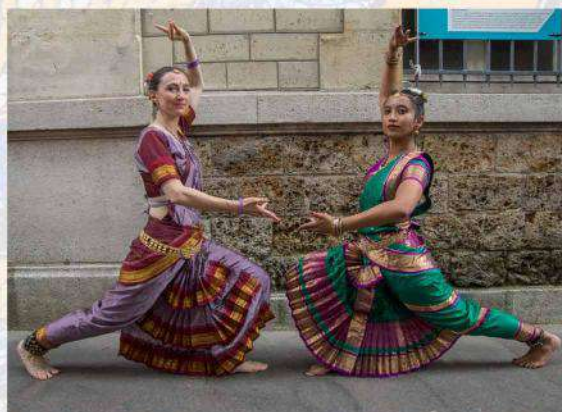
Association Le Soleil d'Or