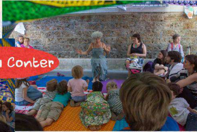
Tente à Conter