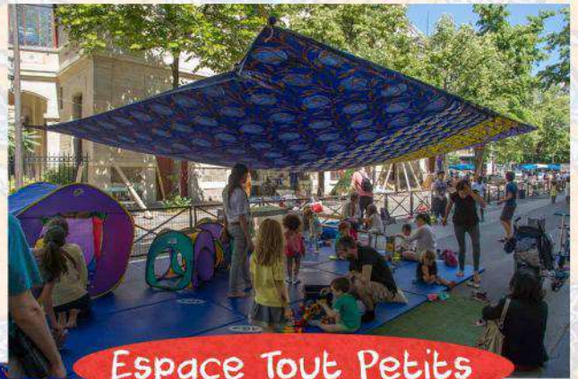
Espace Tout Petits