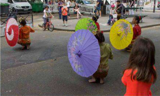
Association Pantja Indra