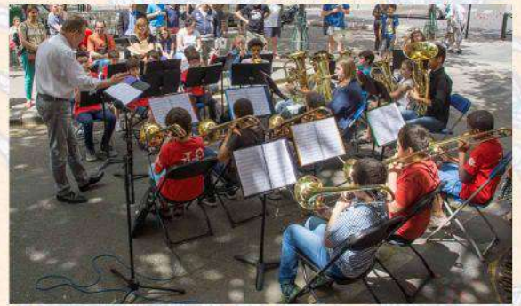
Brass Band du Conservatoire du XII e