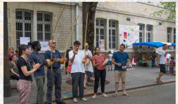
Capoeira Chamada de Angola